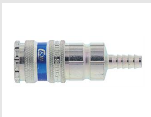
Eurocode 130920 Coupleur pour tuyau 3 / 8 (10mm)