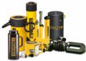
Vérins et systèmes de levage

Des outils d'élite. Pour l'élite des professionnels.