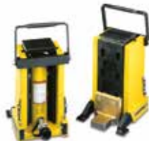
Vérins hydrauliques à patte