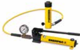
Jeux de vérins-pompes