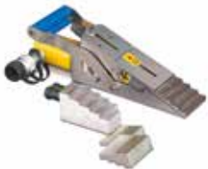
Écarteurs de levage