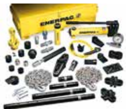
Ensembles de maintenance