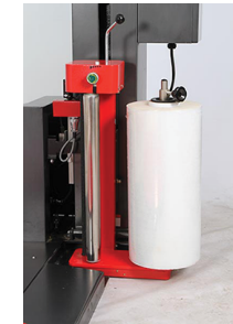
- Tension de film mécanique et réglage de tension par un moteur réducteur.