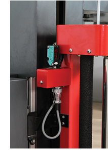
- Photocellule pour la détection de la hauteur de la palette.