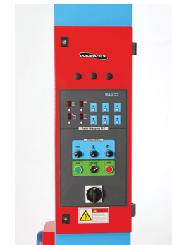
Tableau de fonctionnement simple à manipuler.